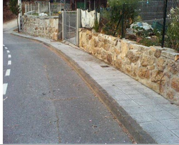
Estado Actual 11.06.2014